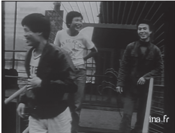
FIGURE 1 • Le groupe Dragon de Canton présenté au journal de TF1 le 7 février 1982