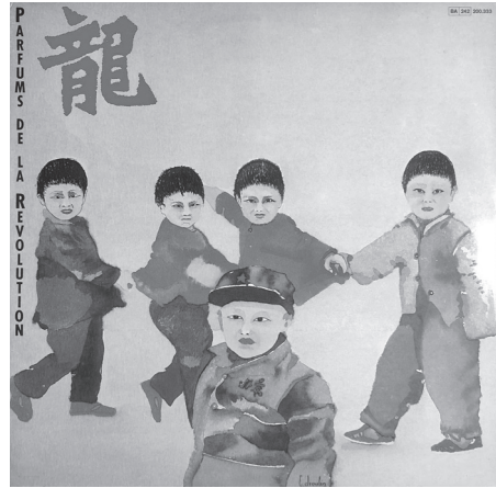
FIGURE 2 • Pochette du 33 tours des Dragons, Parfums de la révolution , 1982